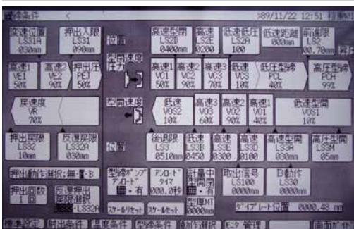
現状のIV-VLモノクロ画面