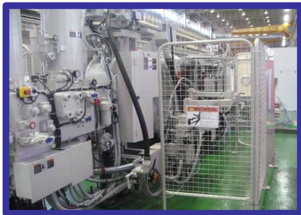
射出カバー Injection cover