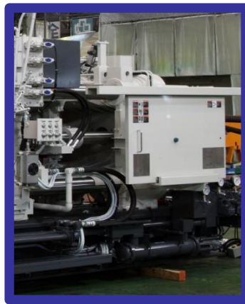
トグルサイドカバー Toggle side cover