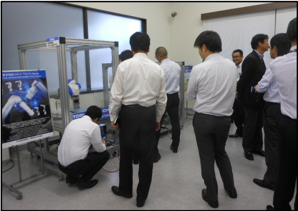
<ロボット・ショールーム見学会風景>