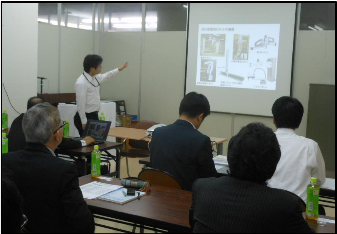
<ロボット商品説明会風景>