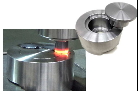
接合事例：密封容器 （鉄鋼材S45C）